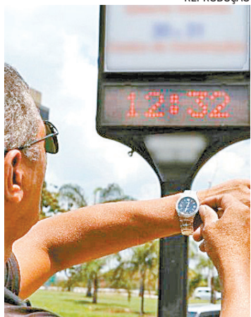
Não haverá horário de verão

O Ministério de Minas e Energia informou que o governo não vai retomar o horário de verão neste ano. A pasta justificou a falta de tempo hábil para não voltar